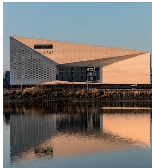
Visuel non contractuel

Destinée à tous les Néo-Aquitains, la Méca situe Bordeaux au croisement des axes de Poitiers, Limoges et Bayonne dans un quartier en plein essor. Conçue comme une arche asymétrique surplombant la Garonne, elle incarne un équipement phare, symbole d'une politique culturelle régionale ambitieuse, ouverte sur ses territoires.