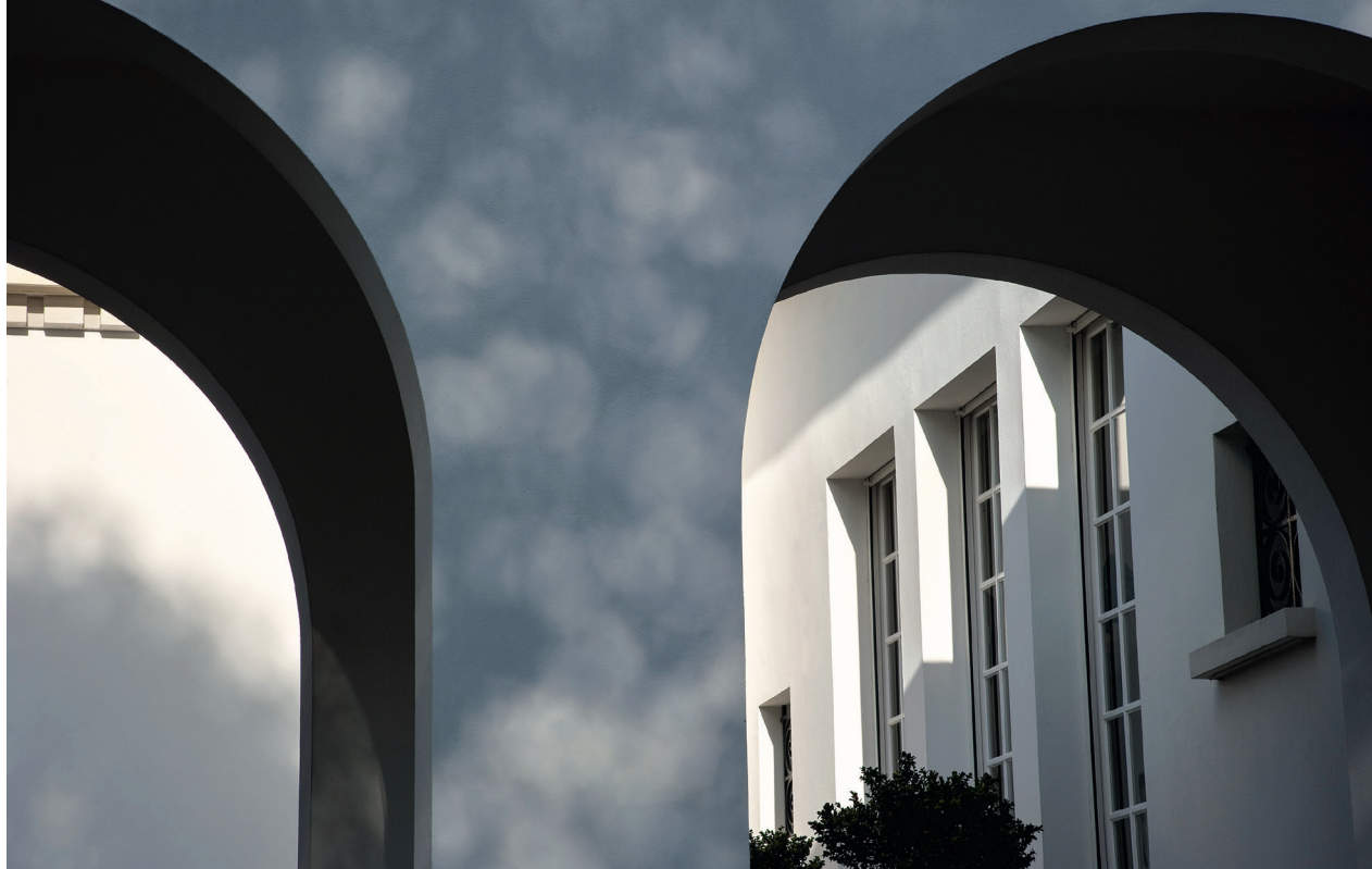
Villa Capeyron-Blanc, à Mérignac