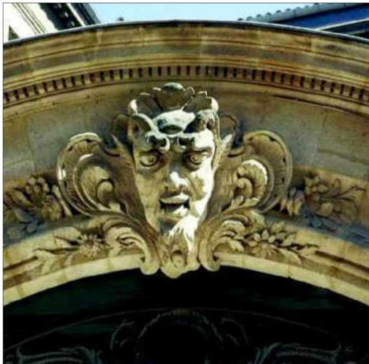
Visage de faune, milieu du XIX e siècle, Hôtel de Brasserie, 22 rue Margaux, type de mascarons romantique

Arpentant la ville, l'historien a patiemment répertorié le petit millier