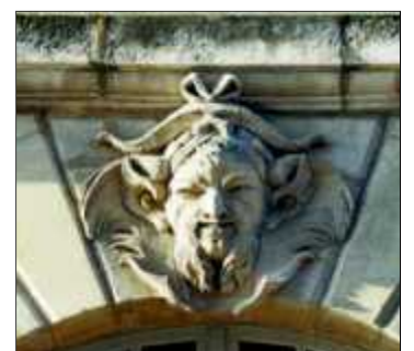
Faune, 1750, C.C Francin, pavillon place de la Bourse