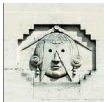
Art déco, 1930, 9 rue Mexico