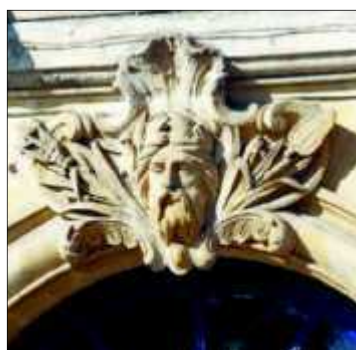
Neptune, 1750, allées Tourny