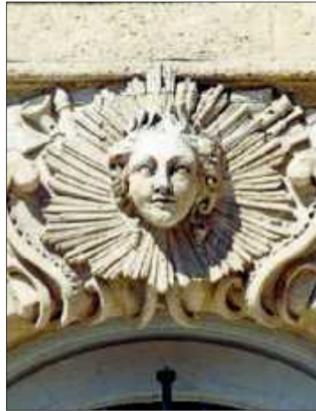
Apollon, Hôtel Saint-Savin. Allégorie de l'Afrique, de Francin, 1750, place de la Bourse, et masque de coquillages, 1927, par Pascal-Désir Maisonneuve

Le Caravan Jazz Club. Jam Session. De 17 h à 19 h. La Belle Lurette. 2, place du Général-de-Gaulle. Entrée libre. 05 56 63 02 42. www.bar-labellelurette.com