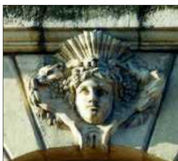
Bacchus, 1750, C.C Francin, pavillon place de la Bourse